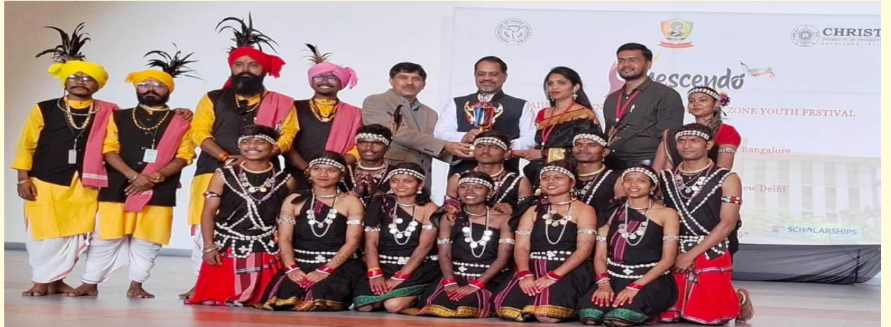
राष्ट्रीय युवा महोत्सव में महाविद्यालय के विद्यार्थियों के रंगारंग भागीदारी एवं द्वितीय पुरस्कार विजेता