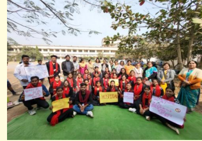
प्राणी शास्त्र विभाग द्वारा स्वास्थ्य जागरूकता पर विस्तार गतिविधि का आयोजन