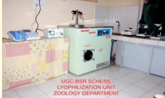
प्राणी शास्त्र प्रयोगशाला