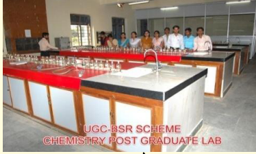
रसायन शास्त्र प्रयोगशाला