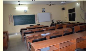
भौतिक शास्त्र स्मार्ट क्लास रूम