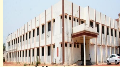
रूसा द्वारा निर्मित नवीन व्याख्यान कक्ष