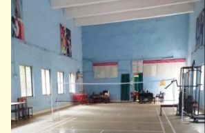
इन्डोर बैडमिंटन हॉल