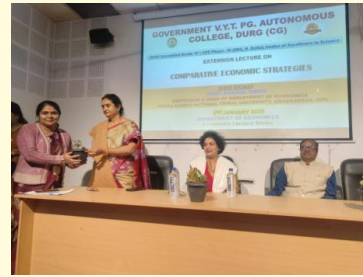
अर्थशास्त्र विभाग में व्याख्यान का आयोजन