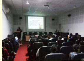
स्वामी विवेकानंद हॉल