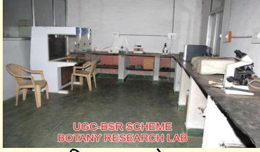
वनस्पति शास्त्र प्रयोगशाला