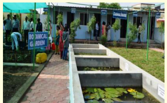
बायो रिसोर्स काम्पलेक्स