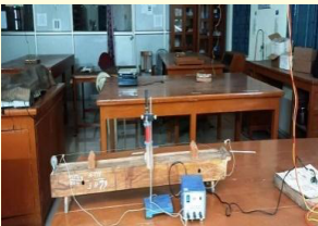
भौतिक शास्त्र प्रयोगशाला