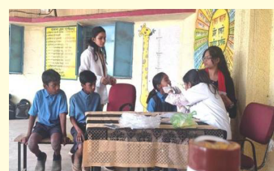
प्राणीशास्त्र विभाग द्वारा दंत परीक्षण शिविर का आयोजन