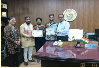
महाविद्यालय के विद्यार्थियों का अंतर्राष्ट्रीय योगासन प्रतियोगिता हेतु चयन