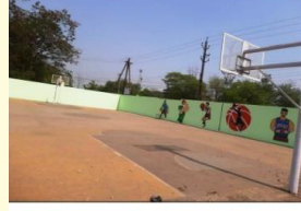
महाविद्यालय क्रीडा मैदान