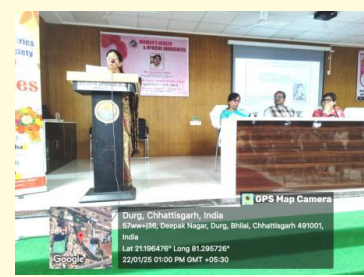
महिला प्रकोष्ठ द्वारा स्त्री स्वास्थ्य एवं स्वच्छता जागरूकता पर व्याख्यान का आयोजन