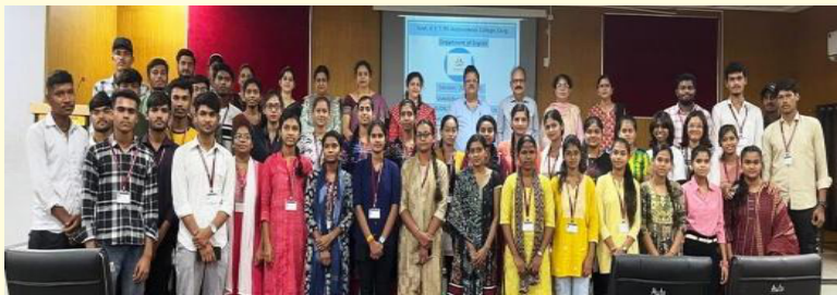
अंग्रेजी विभाग का लिंगवा हब का आयोजन