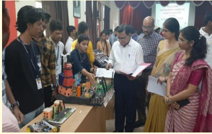
साईस मेला का आयोजन