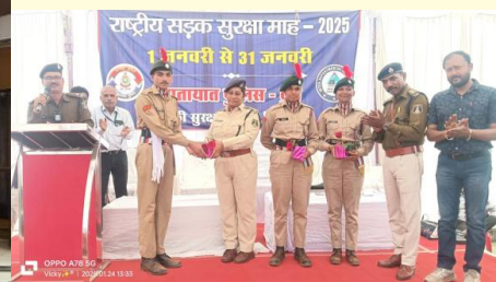
एन.सी.सी. विंग द्वारा राष्ट्रीय सड़क सुरक्षा सप्ताह का आयोजन