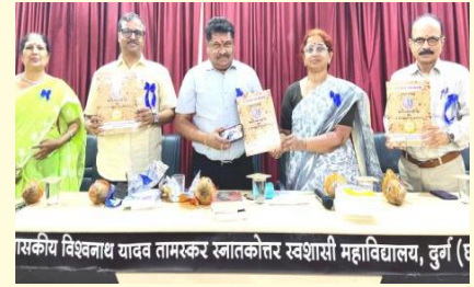
गणित विभाग में गणित परिषद का आयोजन