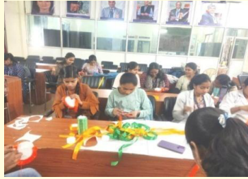
उद्यमिता विकास समिति के द्वारा छात्रों के कौशल विकास हेतु प्रशिक्षण