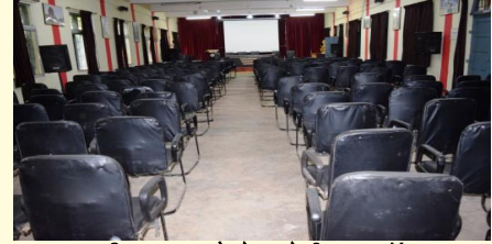
रवीन्द्रनाथ टैगोर सेमीनार हॉल