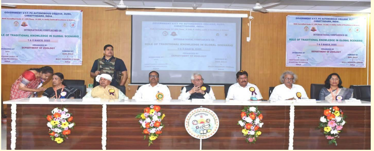
प्राणी शास्त्र विभाग द्वारा रोल ऑफ ट्रेडिशनल नॉलेज इन ग्लोबल सिनारियो पर अंतर्राष्ट्रीय कान्फ्रेंस