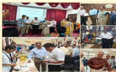
भौतिक शास्त्र विभाग द्वारा विभिन्न गतिविधियों का आयोजन