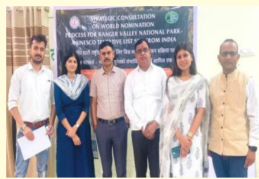
कांकेर घाटी को यूनेस्को विश्व धरोहर घोषित करने हेतु प्रयासरत् कमेटी में महावि. की भूमिका