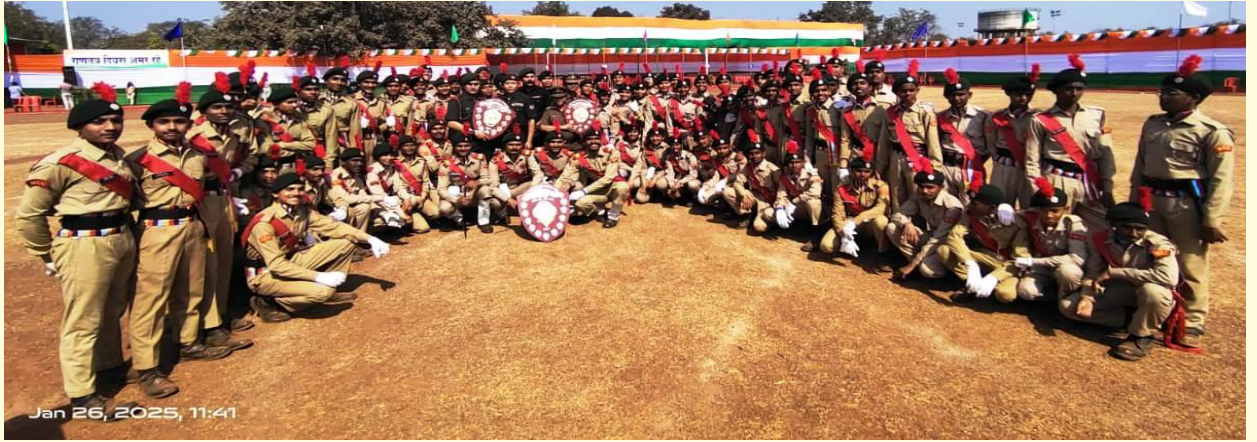
गणतंत्र दिवस परेड में महाविद्यालय के एन. सी. सी. विंग पुरस्कृत