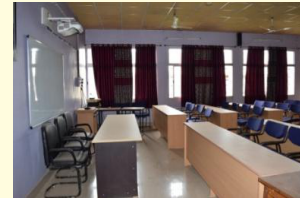
एपीजे स्मार्ट क्लास रूम