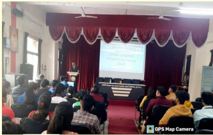
वाणिज्य एवं प्रबंध विभाग के द्वारा ज्ञान चेतना व्याख्यान माला 2025 का आयोजन