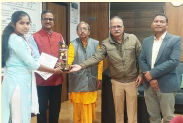
राज्य स्तरीय भारतीय संस्कृति ज्ञान परीक्षा में महाविद्यालय की छात्रा द्वितीय पुरस्कार विजेता