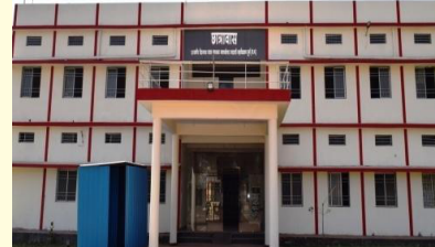
छात्रों हेतु उपलब्ध महा. का छात्रावास